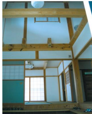
吹き抜ける空間 (イメージ)