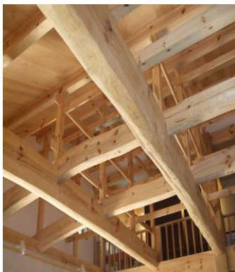
木の香り高い小屋組 (イメージ)