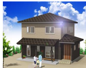
外観パターン・Aタイプ