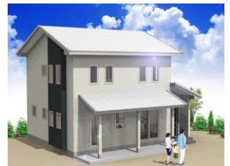
外観パターン・Bタイプ