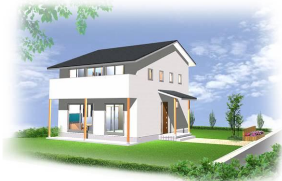
※外観イメージ写真です。外構は含まれません。