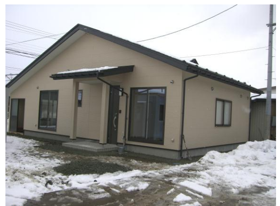
参考プラン イメージ写真