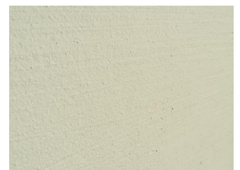
珪藻土の質感 (拡大)