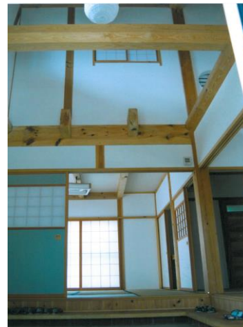
吹抜けのある空間（イメージ）