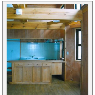
丈夫で長持ち、心の安らぐ住まい