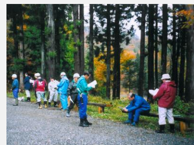
美しい里山とふれあう市民

川上で美しい里山を守り育む林業家(原木供給者)と、中流から下流域の木材加工や流通関係者の連携が図られ、それらが企画・設計コーディネートされ、下流域で里の匠(工務店グループ)の技により、「里山の木の家」を消費者の皆様へお届けする、川上から川下の心を結ぶ「モノづくり」ネットワーク体制です。