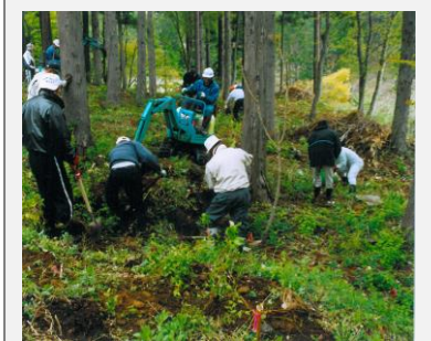
川上で里山を育む人々