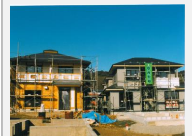
里山の木と技で造る家並み

当グループで生産(建築)された復興住宅等についての維持管理やアフターサービスは、一般に建設されている物件等と全く変わることなく、法律等で定められた基準に基づいて保証される他、グループとして特に定める「維持管理マニュアル」をもって、消費者の皆様と長期的な対応をして参ります。