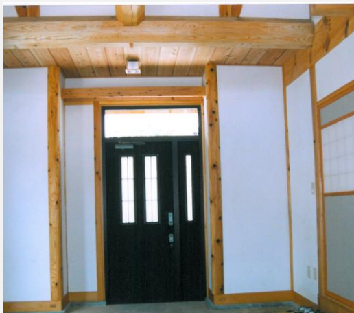
木の香り高い住まい（イメージ）