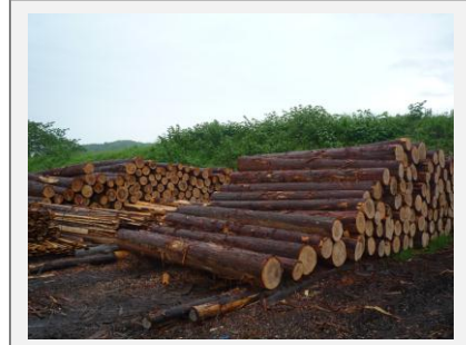
有限会社鈴木建設 生産・流通ネットワークのグループ体制