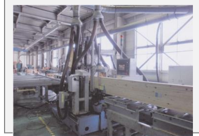
○キクチ工務店 復興住宅生産・流通ネットワーク体制