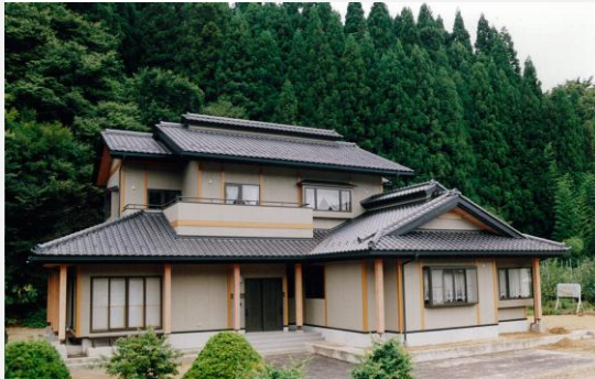
和風 2 世帯住宅