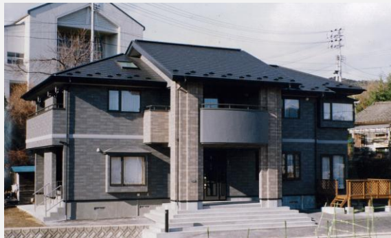
和洋の 2 世帯住宅