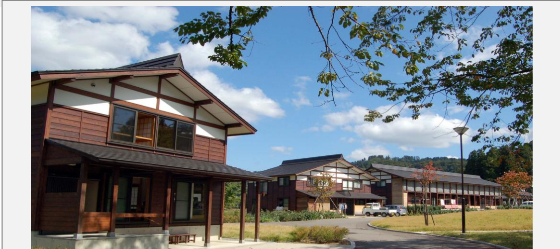
山古志村竹沢団地