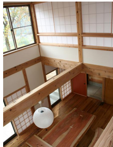
山古志村モデル棟

◇長期的な維持管理のために職人育成をおこないます。慢性的な後継者不足に加え、多くの工務店、大工が被災したことにより、3年後以降の職人確保が課題です。幸いにも当グループの工務店は被災をまぬがれ、気仙大工の第一人者としての実績と陸前高田訓練校で職人育成の実績のメンバーがそろっています。外部の力を借りながら、気仙大工の伝統の継承と職人育成をめざした「ひとつづくり」プロジェクトをすすめます。