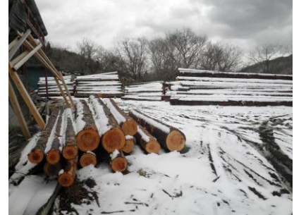
復興住宅三陸の夢を叶える会の住宅供給体制