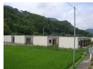
応急仮設住宅建設