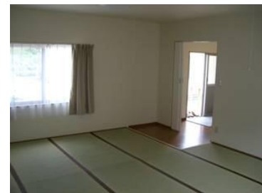
応急仮設住宅建設 (談話室)