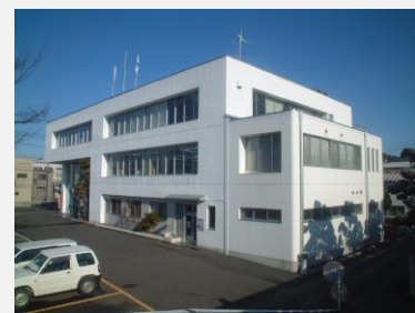
グループ代表:(株)平野組本社