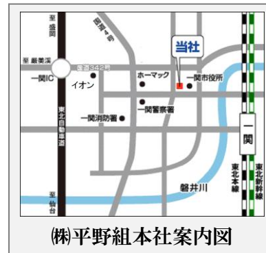
(株)平野組本社案内図