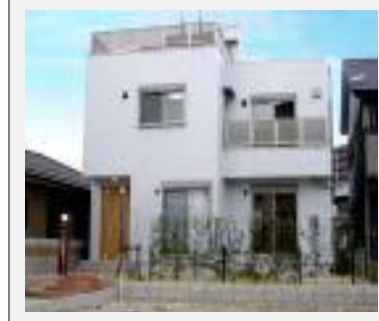
軽量な外装材、金属屋根材採例