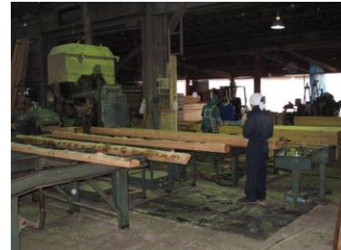
FPグループ 岩手支部地域型復興住宅生産・流通ネットワーク体制

・原木供給の生産は年間 8,000/m 3 、製材加工は年間 24,000/m 3 の能力があり安定供給が可能。また、グループの施工能力は年間 120 棟あり、岩手県全域の地域復興に全力で取組む体制をつくりました。