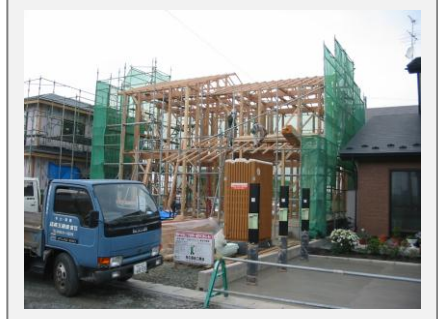
久保田工務店復興住宅生産者グループの体制