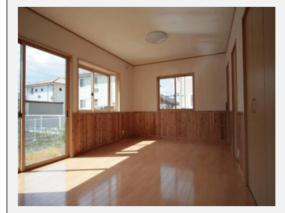
イワベニNEXT・復興住宅生産・流通ネットワークの施工体制

・岩手県森林組合を中心とした供給と、各製材所が其々のルートで仕入れた県産材を、含水率 20%以下にする乾燥機を所有の製材所を通じ、プレカット工場に回して軸組加工を行います。 施工体制は、お取引先の各工務店、建設会社様との共同体制で行いますので、着工スケジュールが決まればそれに合わせた手配が可能です。